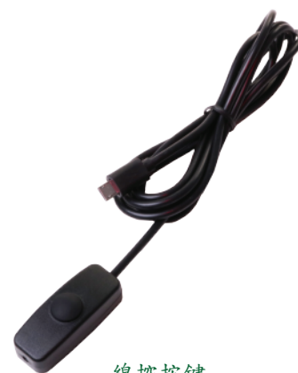
線控按鍵 ( 1.5m )